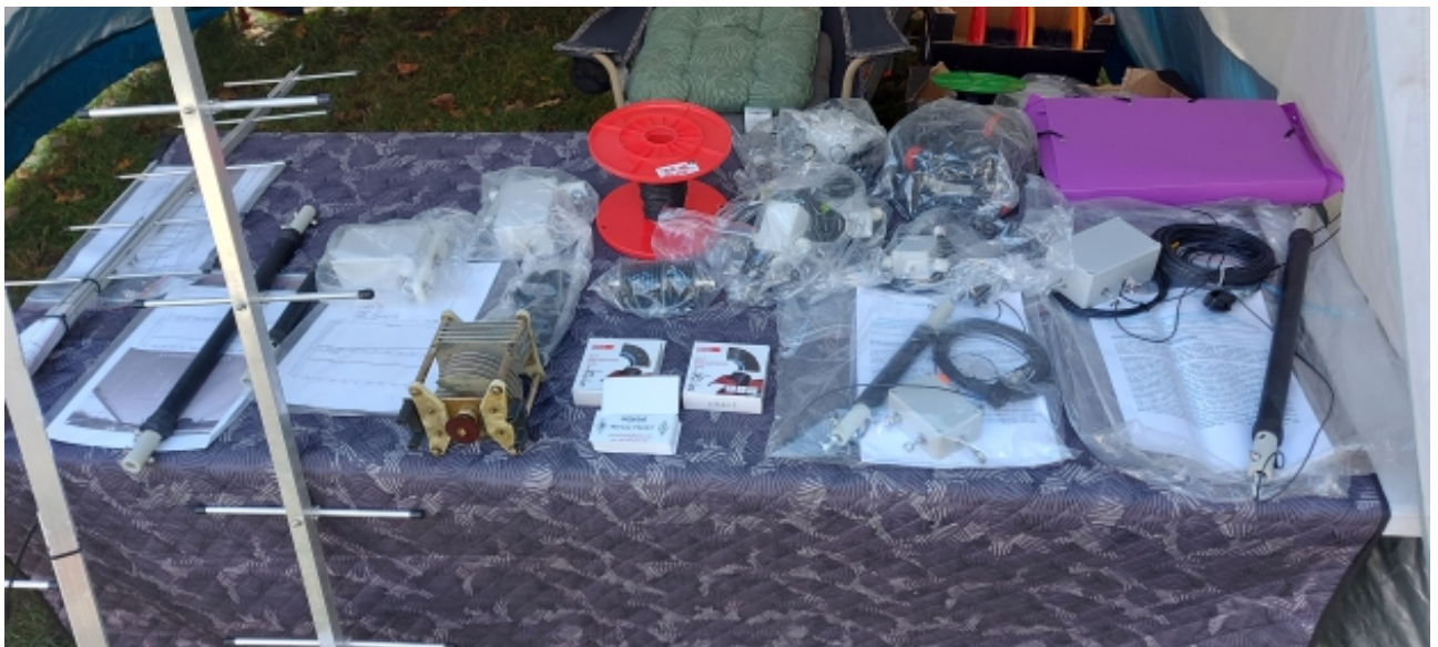
Anteny i osprzęt antenowy SQ6DG